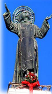
L'obelisco di San Cono