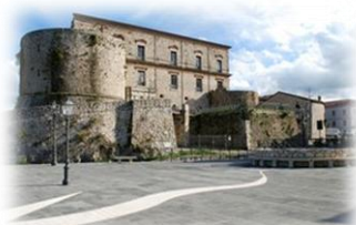
La piazza di Teggiano