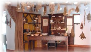
Il Museo delle Erbe