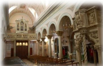
La cattedrale di S. Maria Maggiore