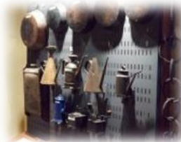
Il Museo della Civiltà Contadina